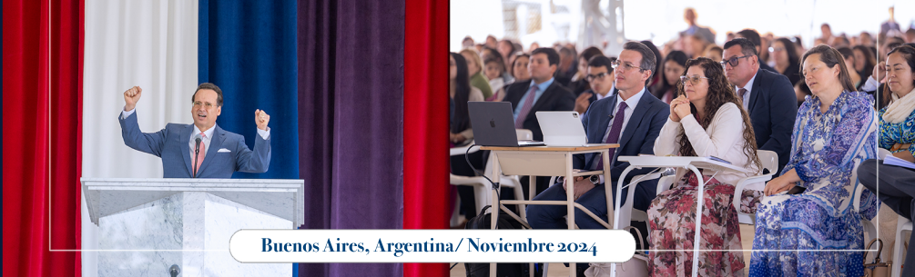
Buenos Aires, Argentina/ Noviembre 2024