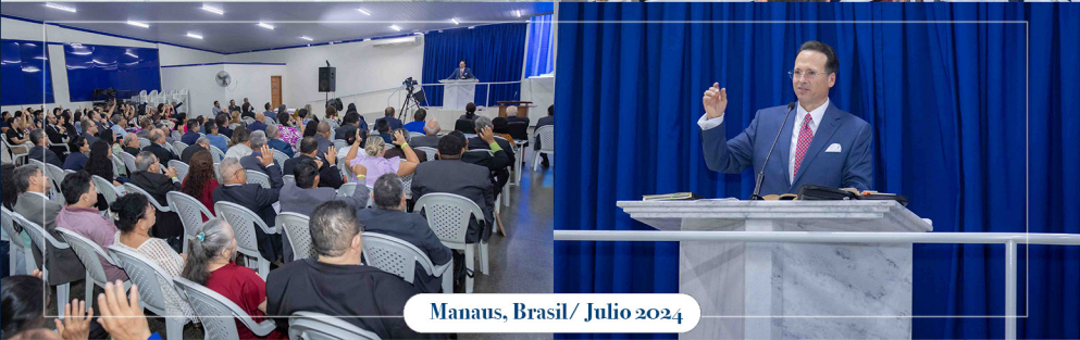
Manaus, Brasil/ Julio 2024