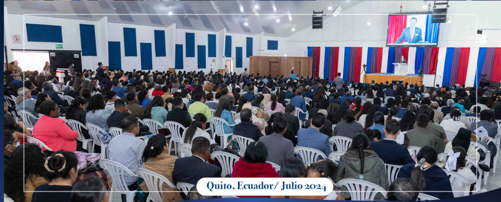
Quito, Ecuador/ Julio 2024