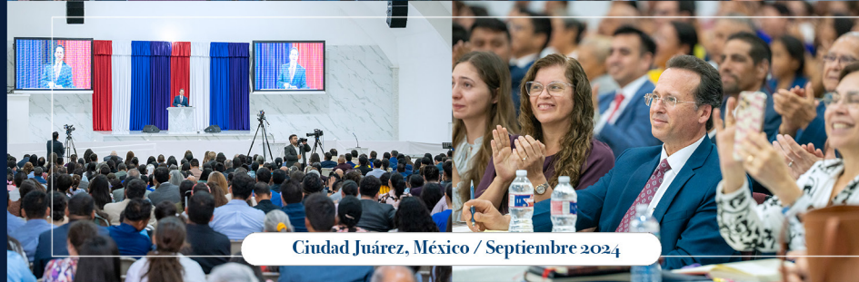
Ciudad Juárez, México / Septiembre 2024