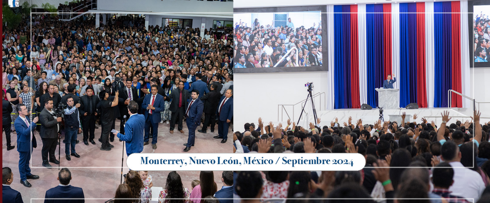
Monterrey, Nuevo León, México / Septiembre 2024