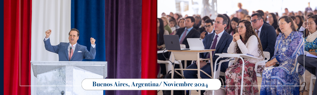
Buenos Aires, Argentina/ Noviembre 2024