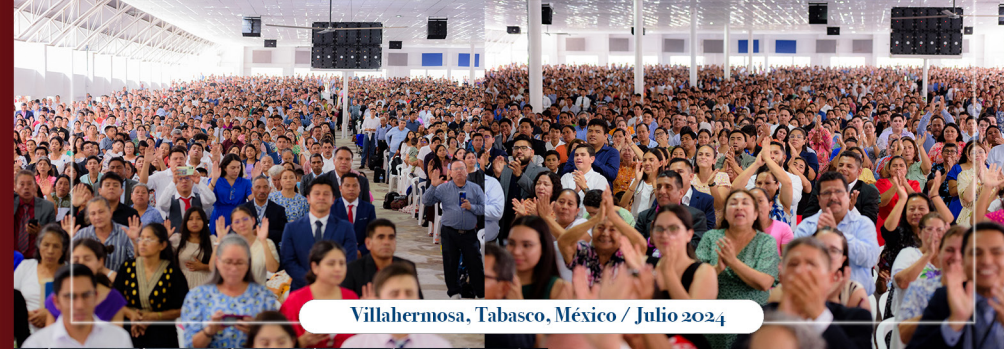
Villahermosa, Tabasco, México / Julio 2024