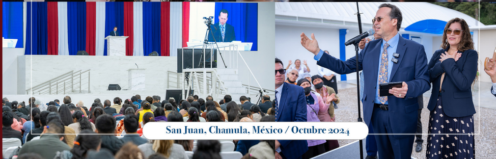
San Juan, Chamula, México / Octubre 2024