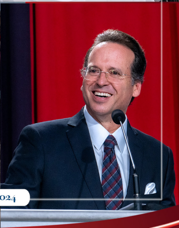
Bogotá, Colombia / Agosto 2024