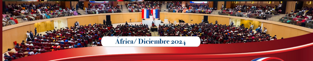
Africa/ Diciembre 2024