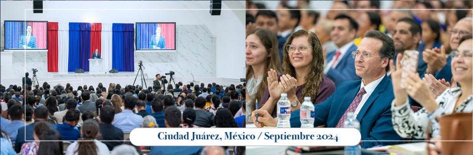
Ciudad Juárez, México / Septiembre 2024