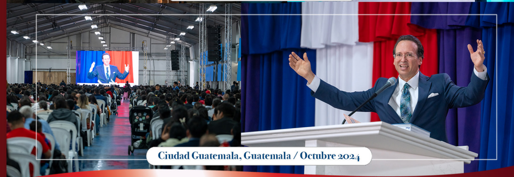
Ciudad Guatemala, Guatemala / Octubre 2024