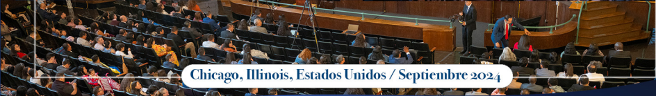
Chicago, Illinois, Estados Unidos / Septiembre 2024