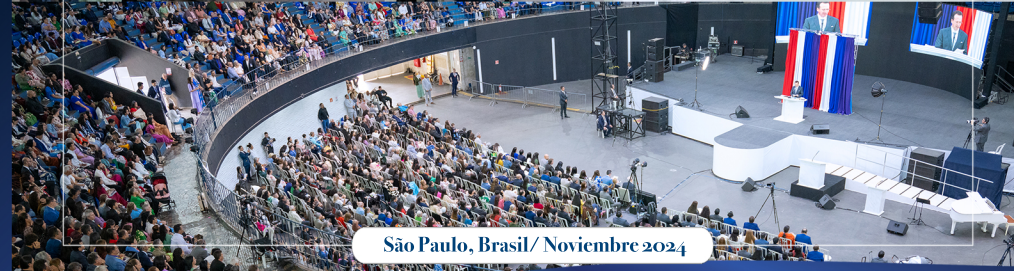
São Paulo, Brasil/ Noviembre 2024