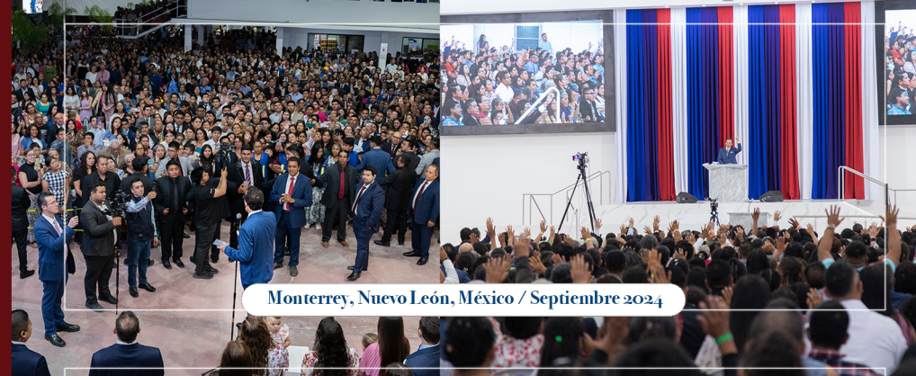
Monterrey, Nuevo León, México / Septiembre 2024