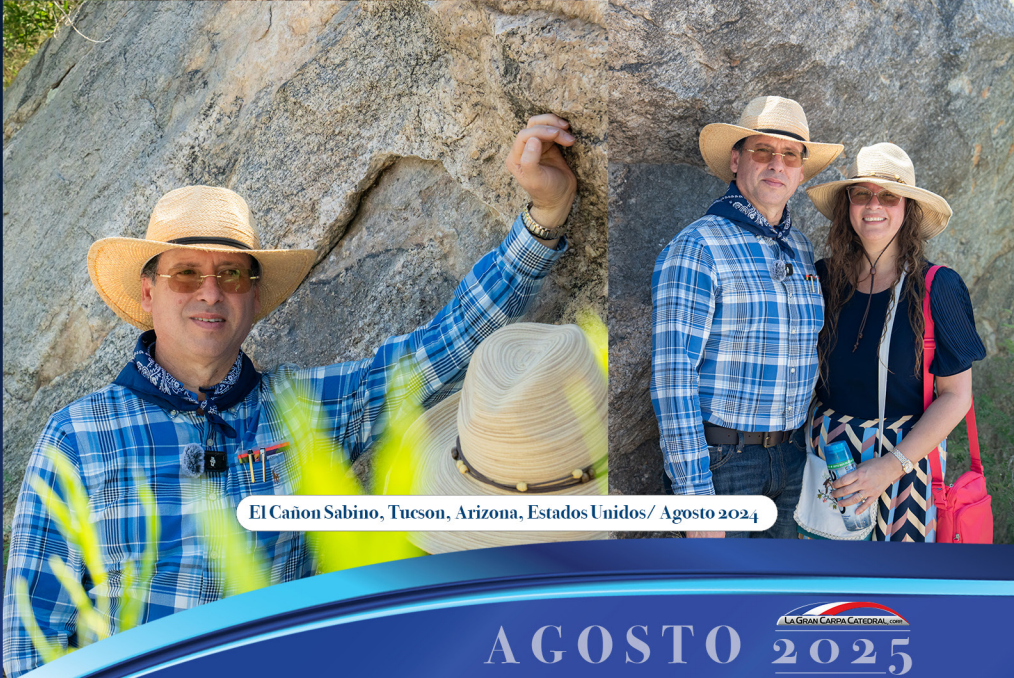
El Cañon Sabino, Tucson, Arizona, Estados Unidos/ Agosto 2024