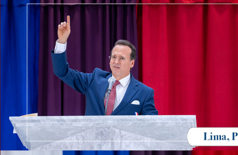
Lima, Perú / Noviembre 2024