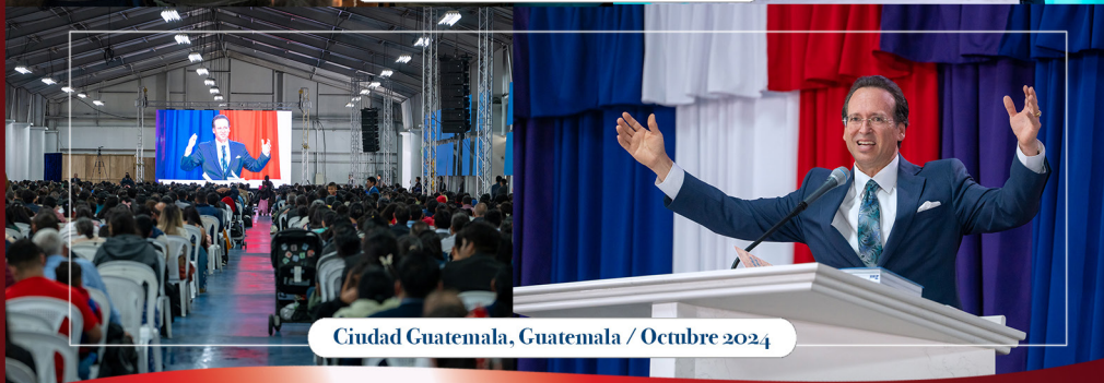
Ciudad Guatemala, Guatemala / Octubre 2024