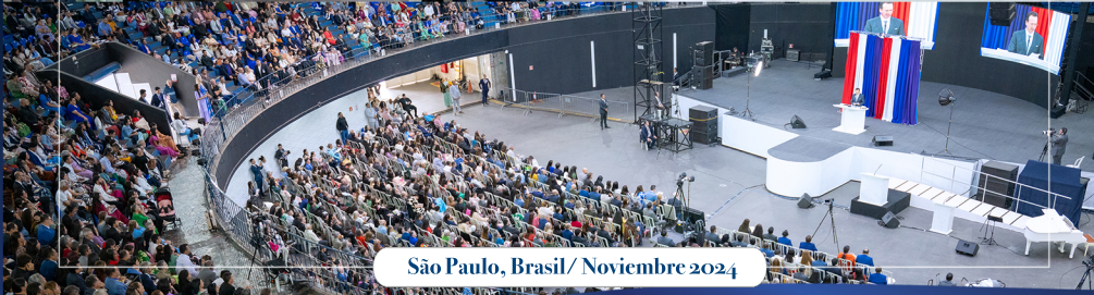
São Paulo, Brasil/ Noviembre 2024