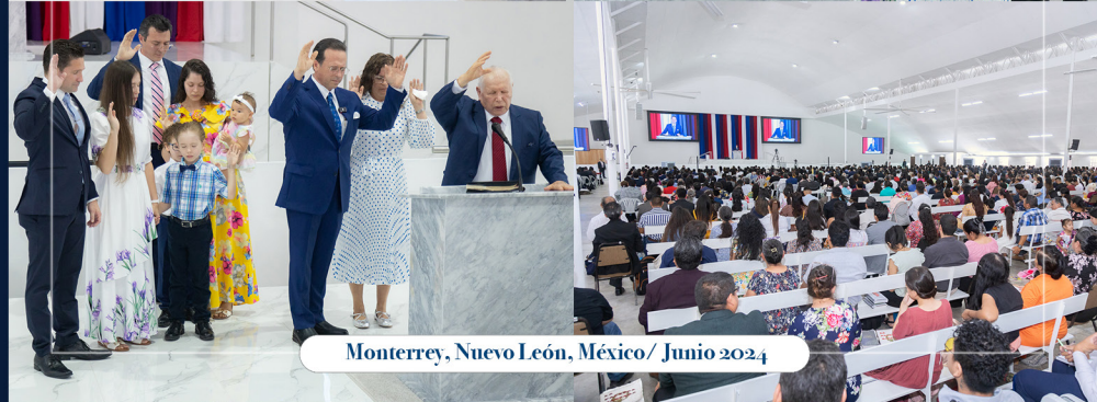
Monterrey, Nuevo León, México/ Junio 2024