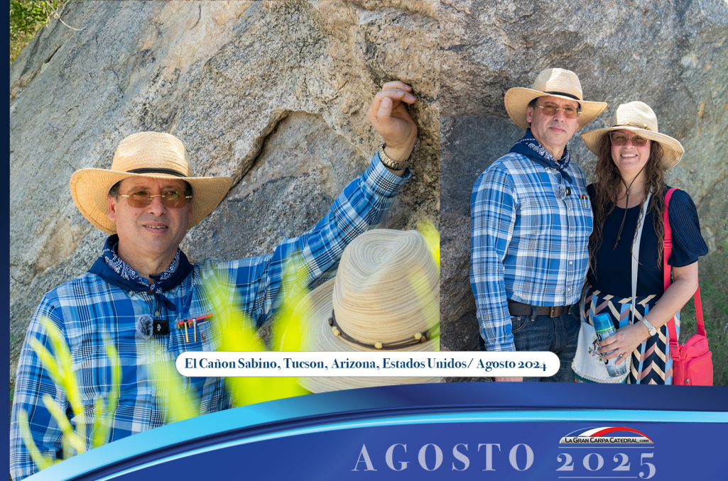
El Cañon Sabino, Tucson, Arizona, Estados Unidos/ Agosto 2024