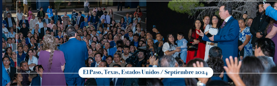
El Paso, Texas, Estados Unidos / Septiembre 2024