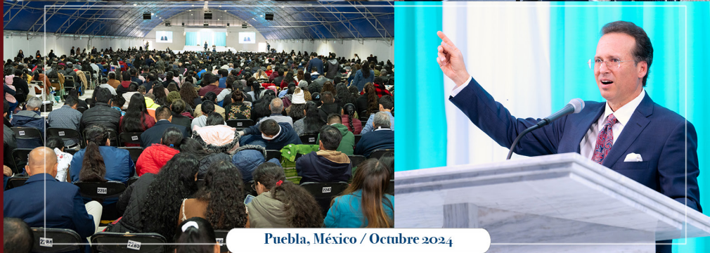
Puebla, México / Octubre 2024