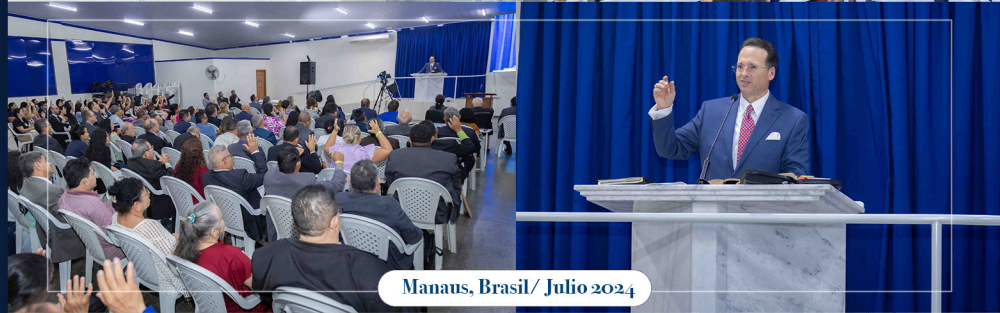
Manaus, Brasil/ Julio 2024