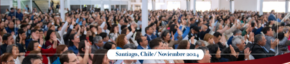
Santiago, Chile / Noviembre 2024