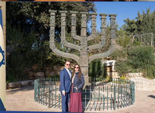
Israel / Diciembre 2024