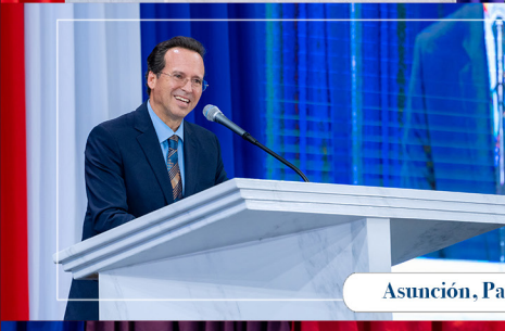
Asunción, Paraguay / Octubre 2024