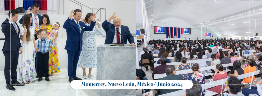
Monterrey, Nuevo León, México/ Junio 2024