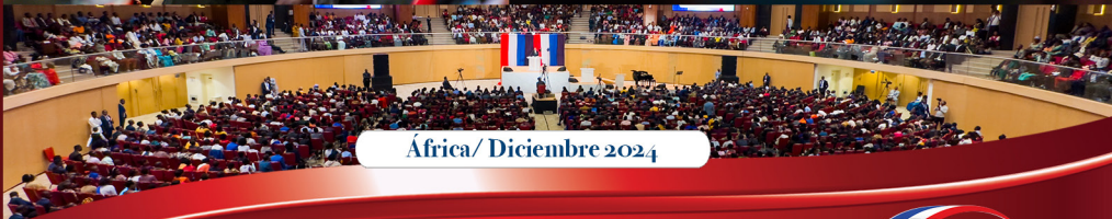
Africa/ Diciembre 2024