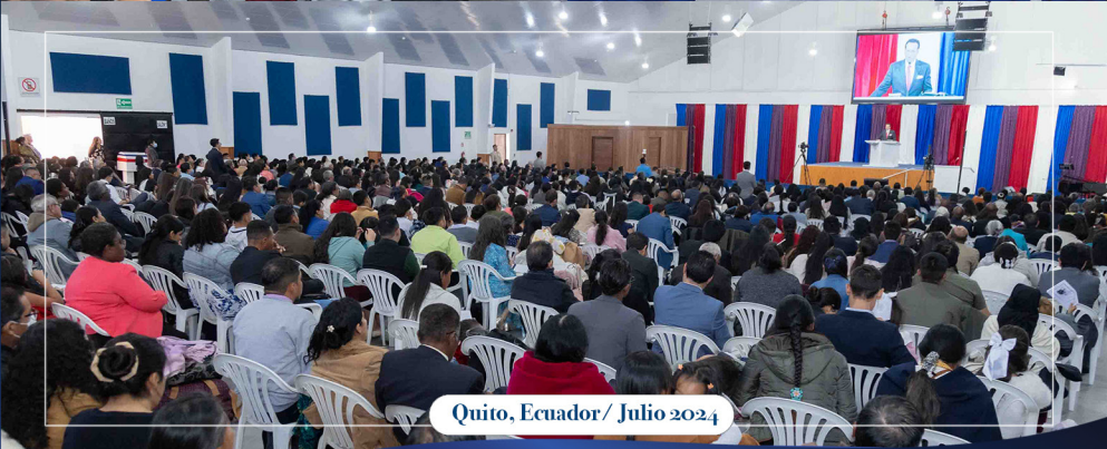
Quito, Ecuador/ Julio 2024