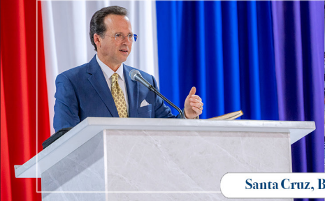
Santa Cruz, Bolivia / Octubre 2024