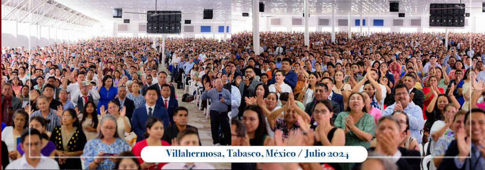
Villahermosa, Tabasco, México / Julio 2024