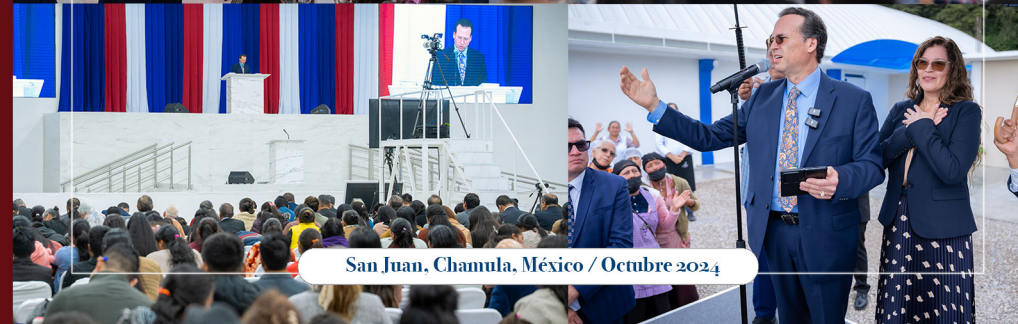
San Juan, Chamula, México / Octubre 2024