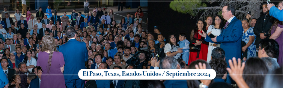
El Paso, Texas, Estados Unidos / Septiembre 2024