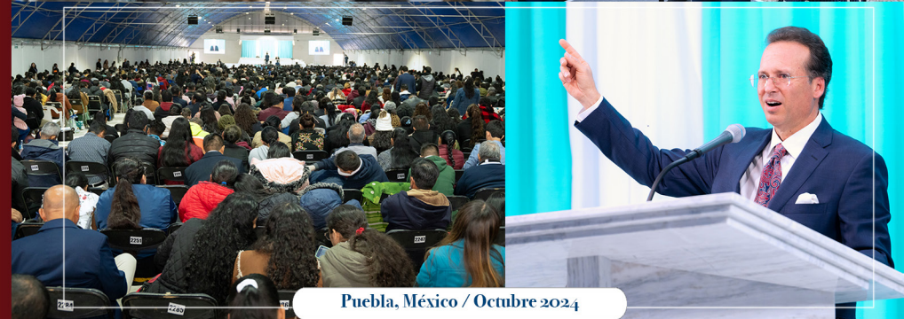
Puebla, México / Octubre 2024