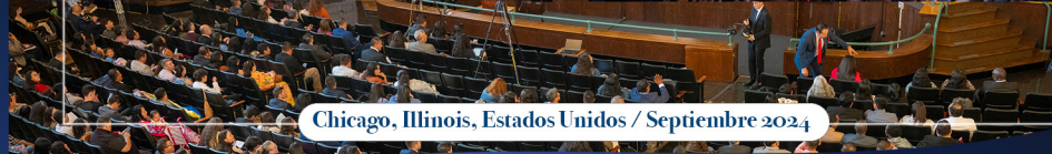
Chicago, Illinois, Estados Unidos / Septiembre 2024