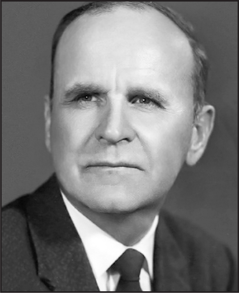
William Marrion Branham