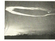
6:30 P.M., W.N.W. OF WINSLOW