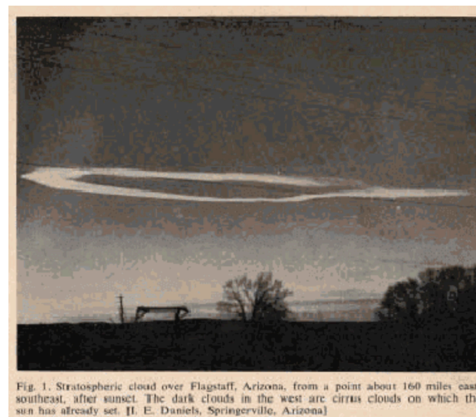
Fig. 1. Stratospheric cloud over Flagstaff, Arizona, from a point about 160 miles east-southeast, after sunset. The dark clouds in the west are cirrus clouds on which the sun has already set.

confirmación, con el fin de establecer la ubicación aproximada y obtener descripciones del mayor número posible de otros observadores.