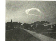
6:15 P.M., N. OF PHOENIX