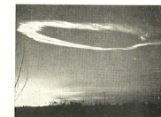
6:30 P.M., W.N.W. OF WINSLOW